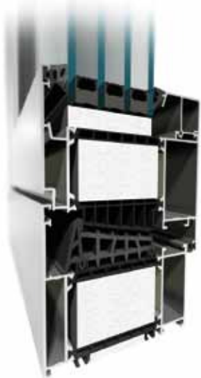
MB-104 Passive Aero