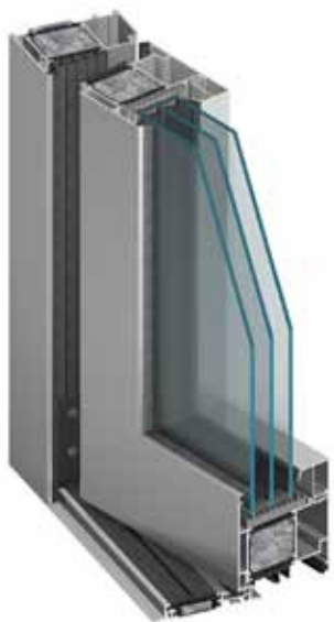
drzwi MB-104 Passive SI