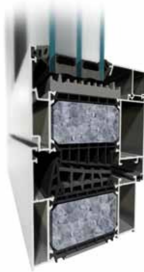
MB-104 Passive SI